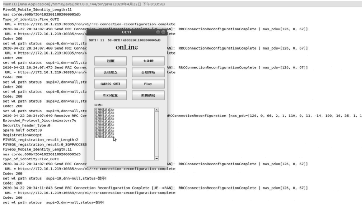
图4 用户端侧注册界面

延、VNF实例化时延。通过实验对比星地联合切片、地面切片与星上切片的实例化时间，分析不同类型切片在资源调度与部署效率上的差异，验证意图驱动网络技术在天地融合网络场景下的高效性与适用性。