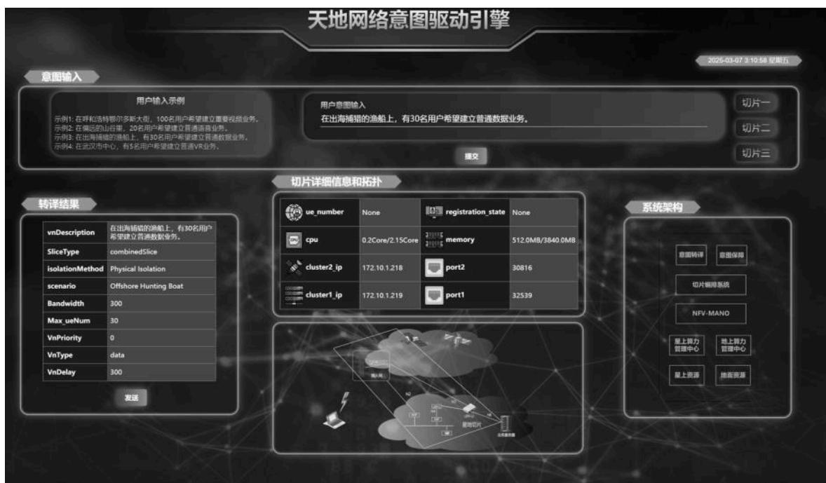
图2 意图驱动天地融合智能编排系统前端界面

意图转译后台在接收到用户意图后，对意图进行关键要素提取，通过训练好的命名实体识别模型并进行意图实体识别，提取出场景（“出海捕猎的渔船”）、用户数量（“30名用户”）以及服务类型（“数据”）。策略配置器基于有限状态